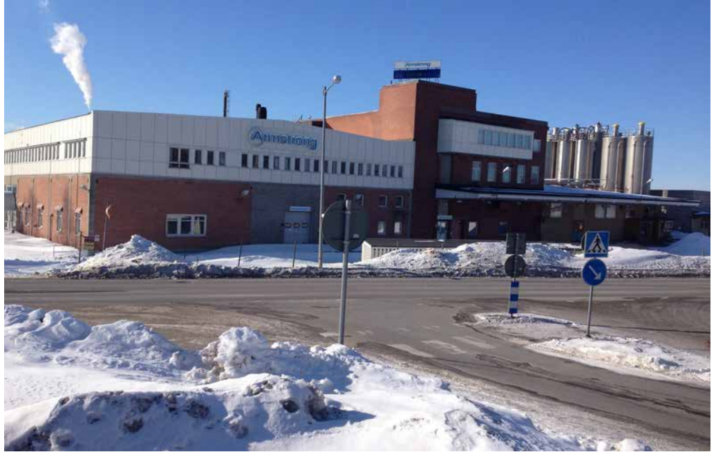
Fabriken som EcoRub övertagit från Armstrongägda Holmsunds Golv.