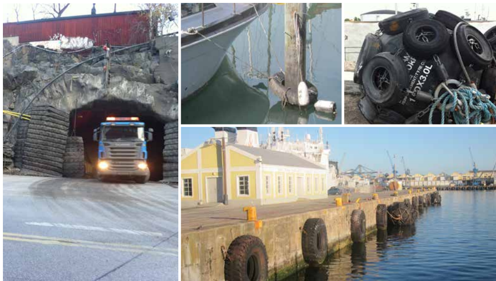
Uttjänta däck kommer till användning i många olika sammanhang.